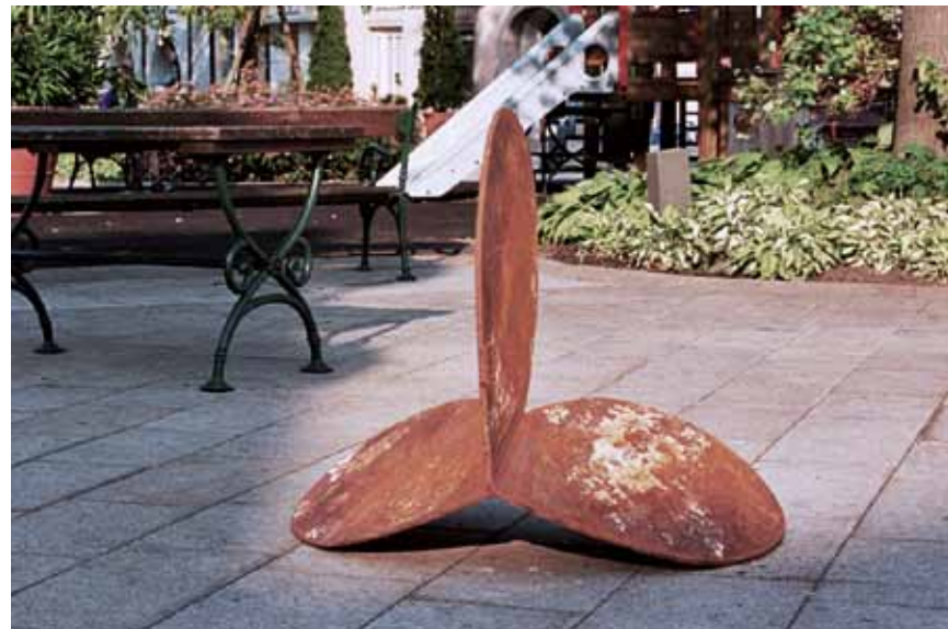
ohne titel | 2006 | metall | 100 x 100 x 120cm ohne titel | 2006 | metall | 180 x 100 x 110cm