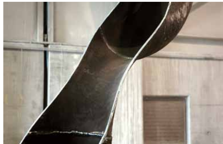
der organische schnitt | 2009 | metall | 300 x 100 x 200cm