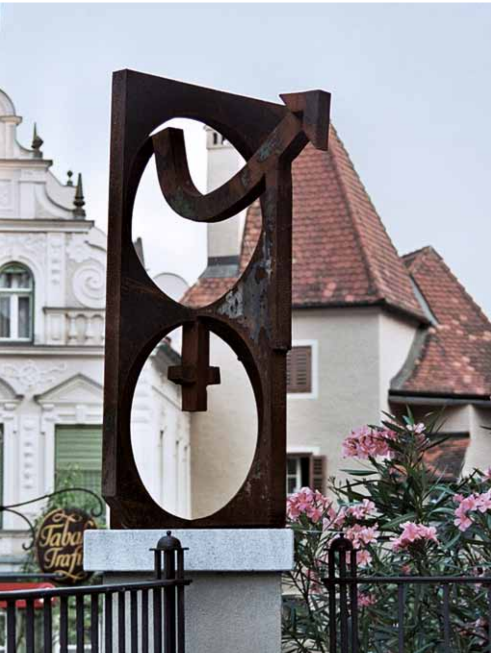
männlich-weiblich | 2006 | metall | 70 x 70 x 140cm