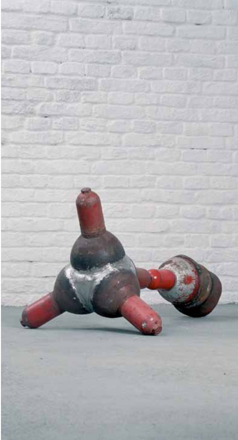
sputnik | 2005 | gasflaschen | 60 x 60 x 100cm