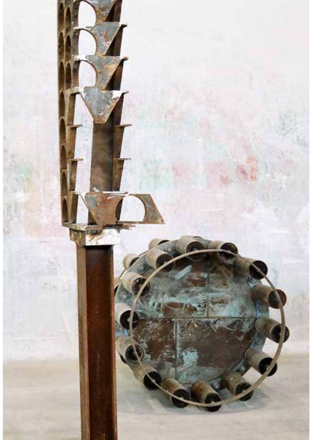
tel aviv | 2006 | metall | 90 x 90 x 300cm