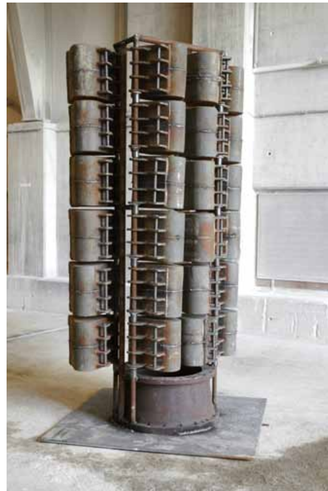
schaufel-schrein | 2009 | metall | 380 x 150 x 150cm