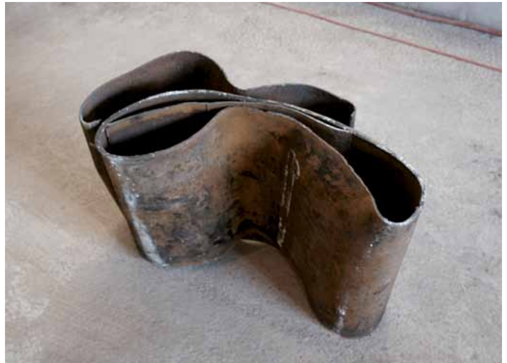
rechts werkgruppe | 2009 | metall | diverse maße