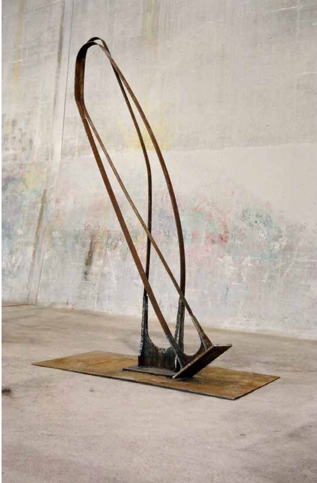
standbein-spielbein | 2006 | eisen | 2 x 3 x 1m endlos-gefluncht | 2006 | eisen | 3 x 2,5 x 2,5m