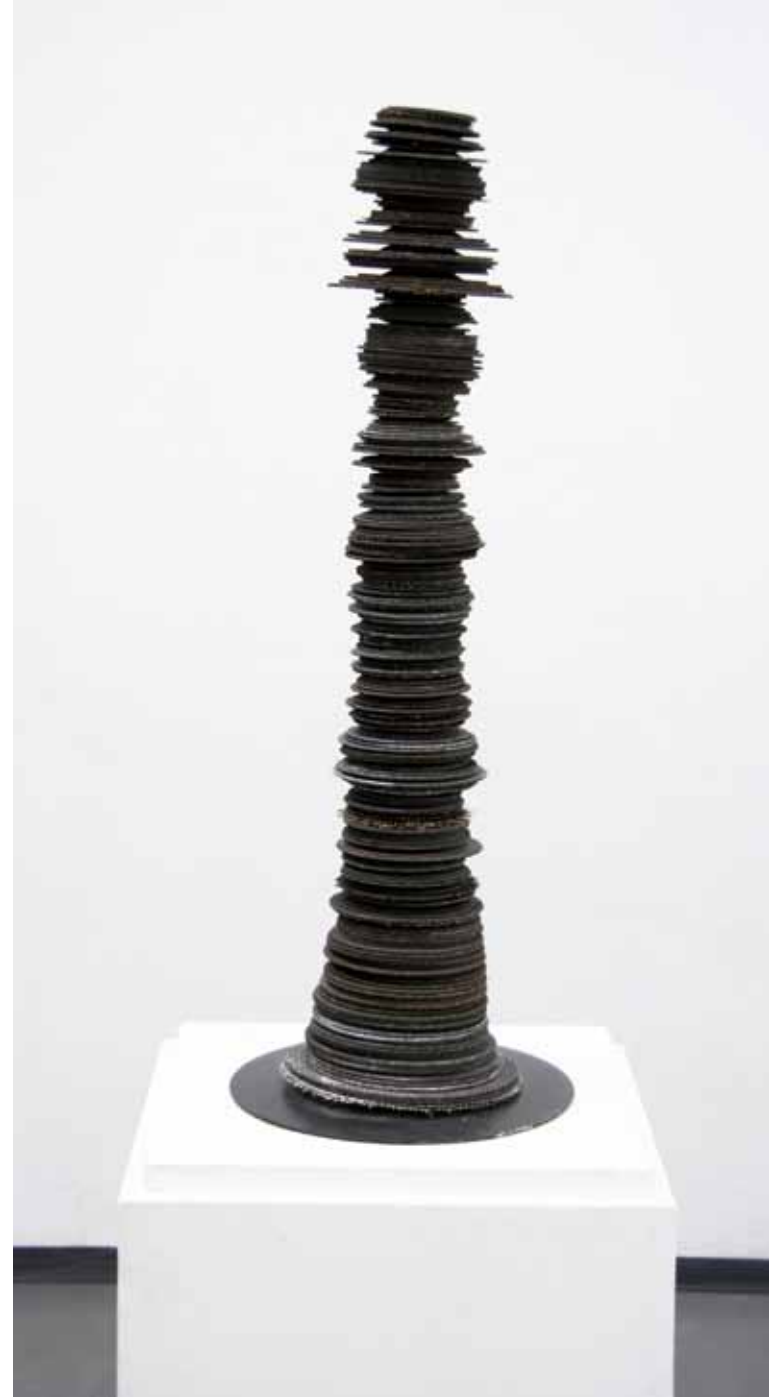
lebensstele 1 | 2008 | flexscheiben, eisen | 15 x 15 x 90cm