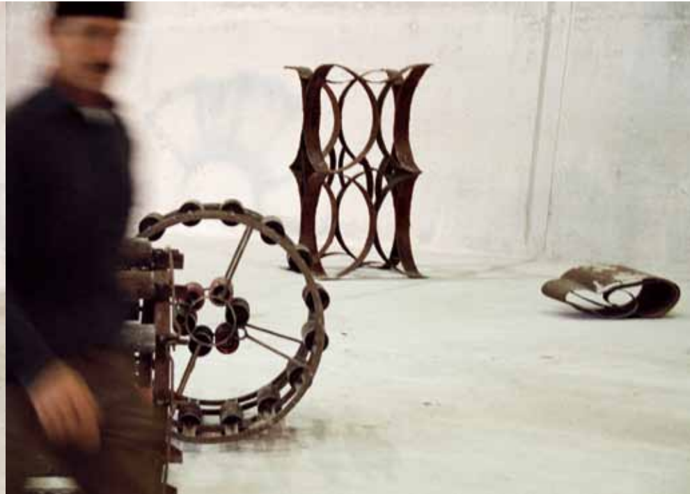
keep on rolling | 2006 | metall | diverse maße