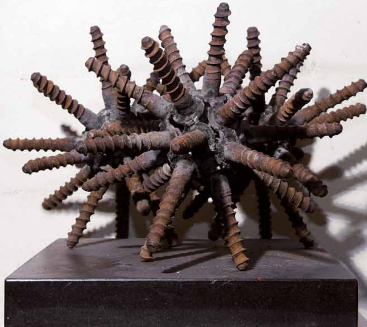
drei sterne | 2008 | schwellschrauben | 50 x 40 x 50cm