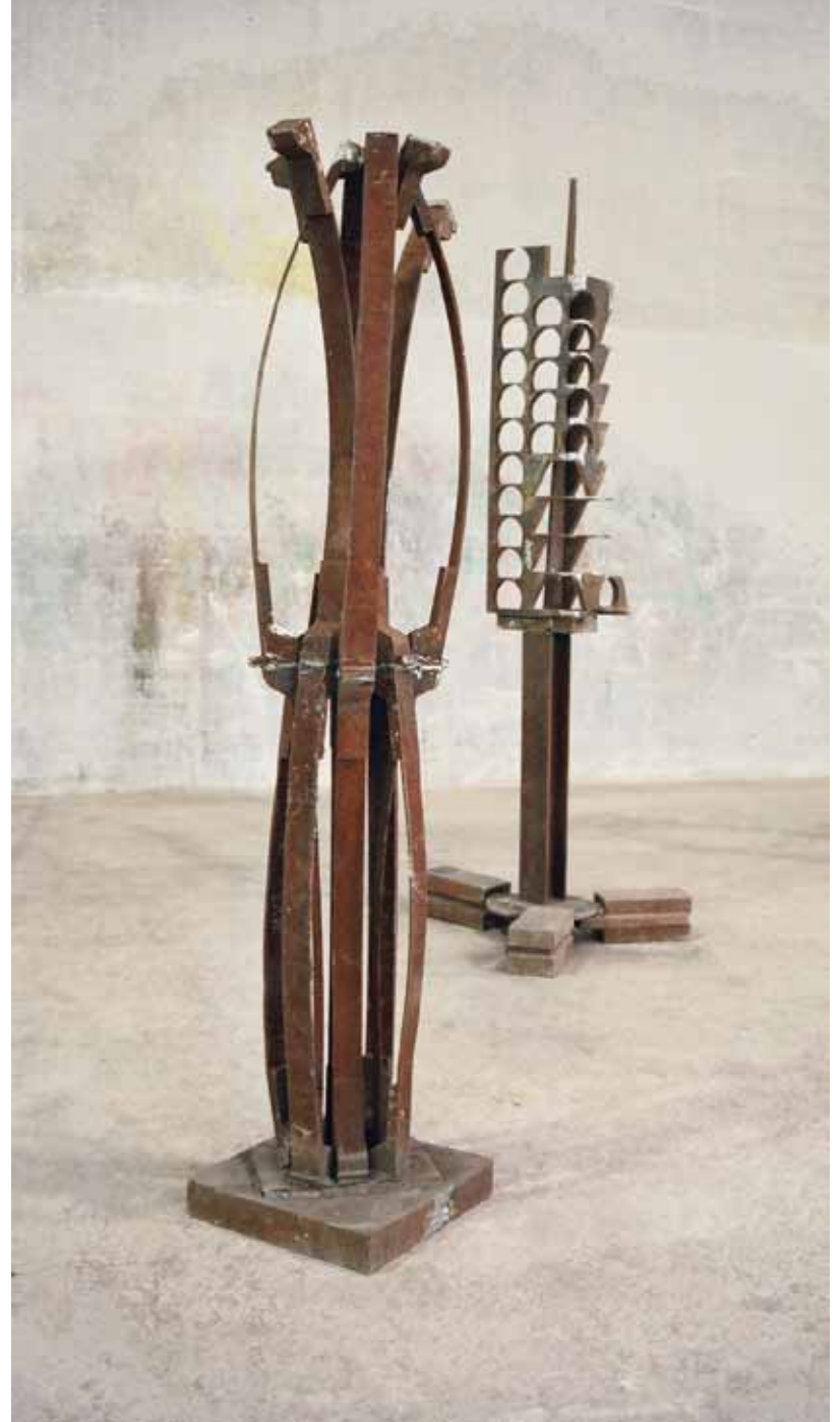
federspiel | 2006 | metall | 70 x 70 x 300cm hinten - tel aviv | 2006 | metall | 90 x 90 x 300cm