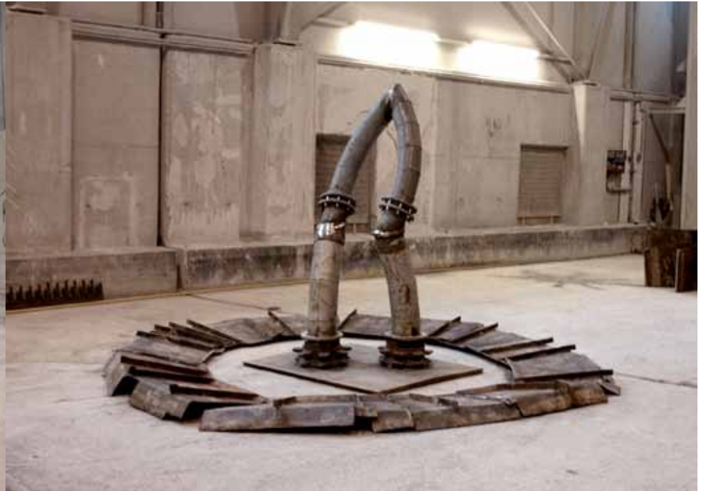
werkgruppe | 2006 | metall | diverse maße moon raker | 2005 | metall | 400 x 400 x 300cm