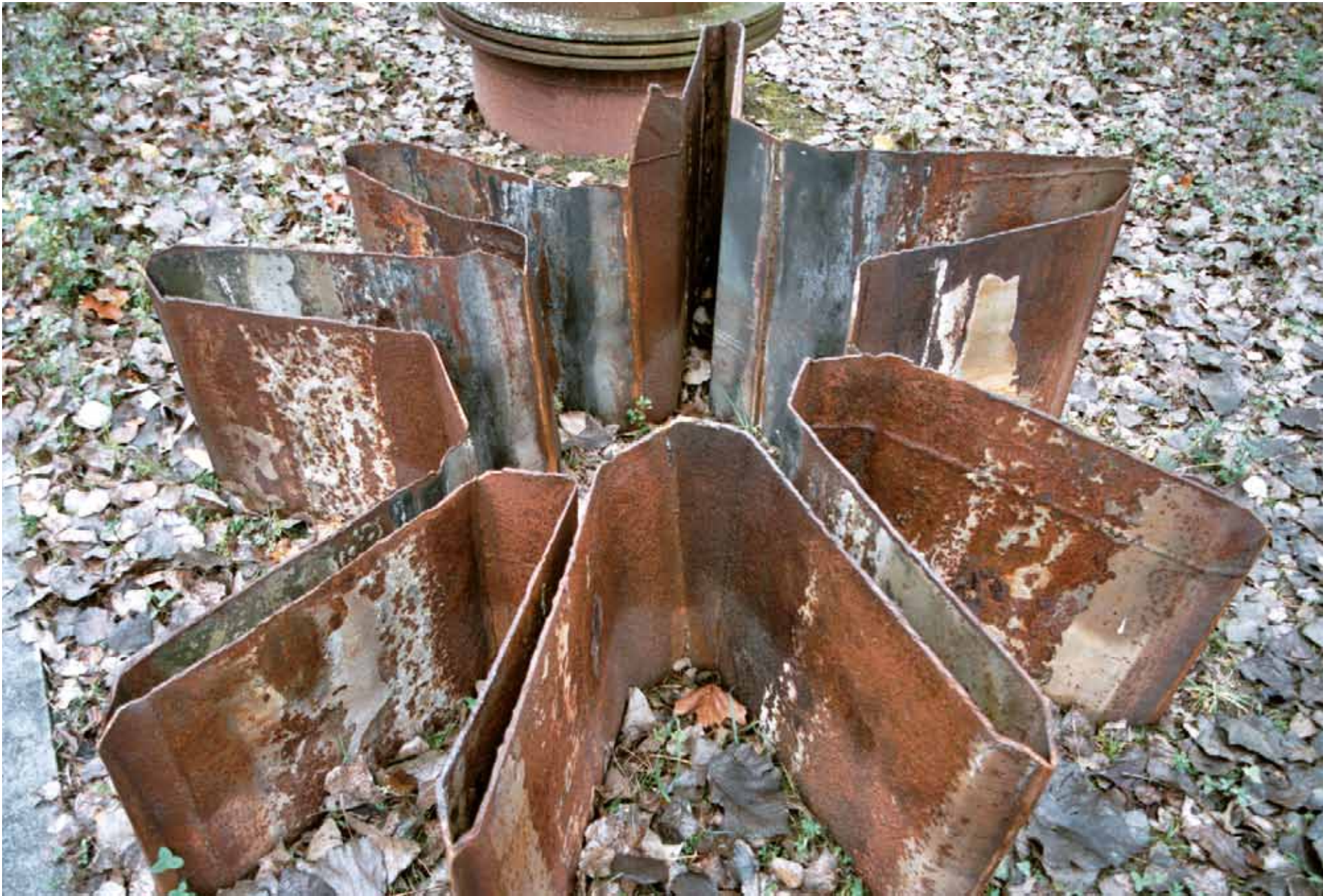
roter stern | 2004 | metall | 190 x 190 x 60cm