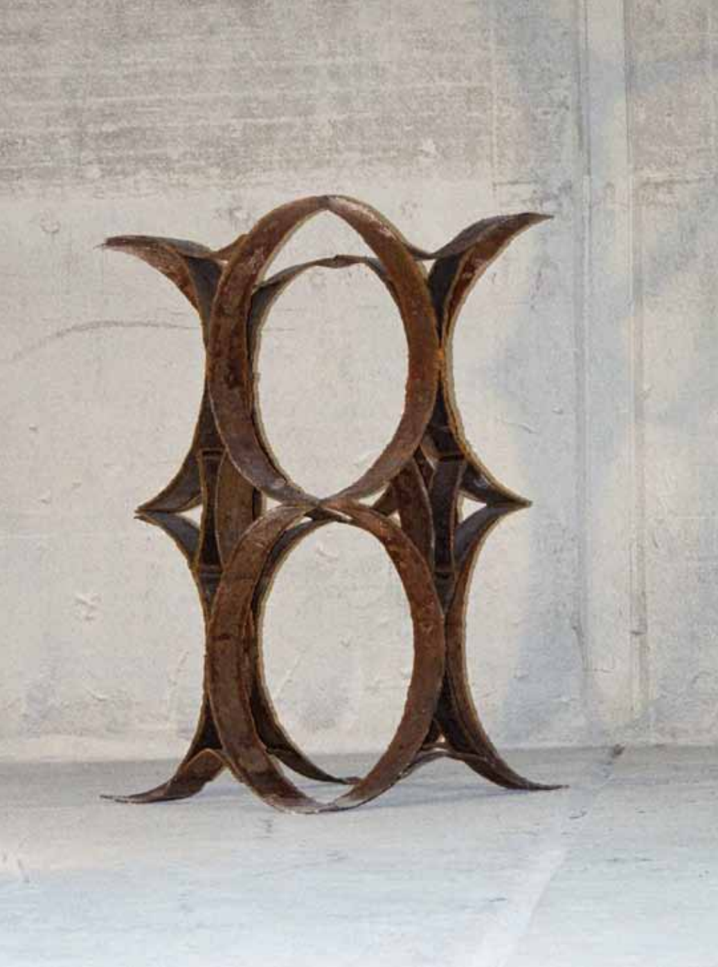
oil arabesque | 2006 | metall | 100 x 100 x 250cm