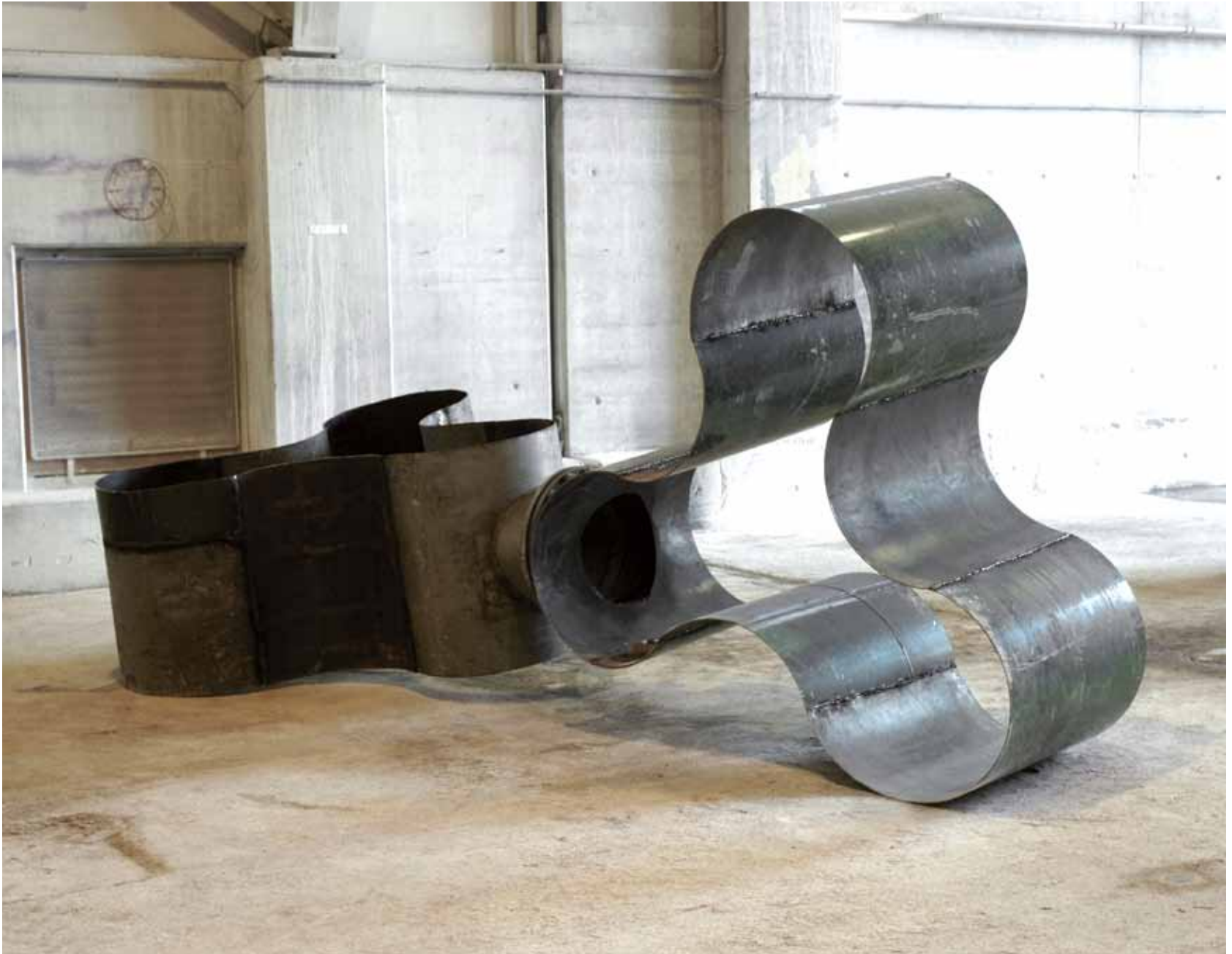
orna/mental-gefluncht | 2009 | metall | 200 x 500 x 200cm